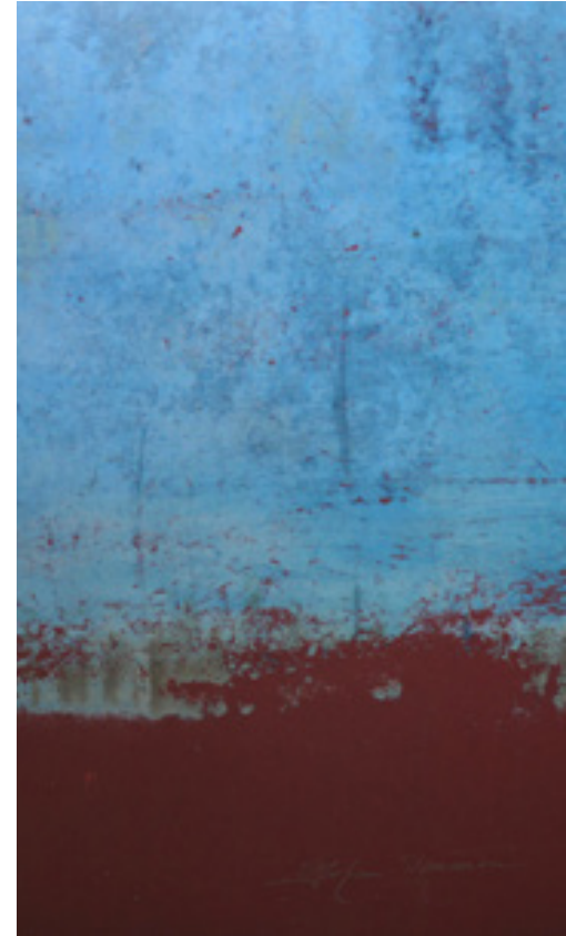
Impression de vagues 65 x 44 cm