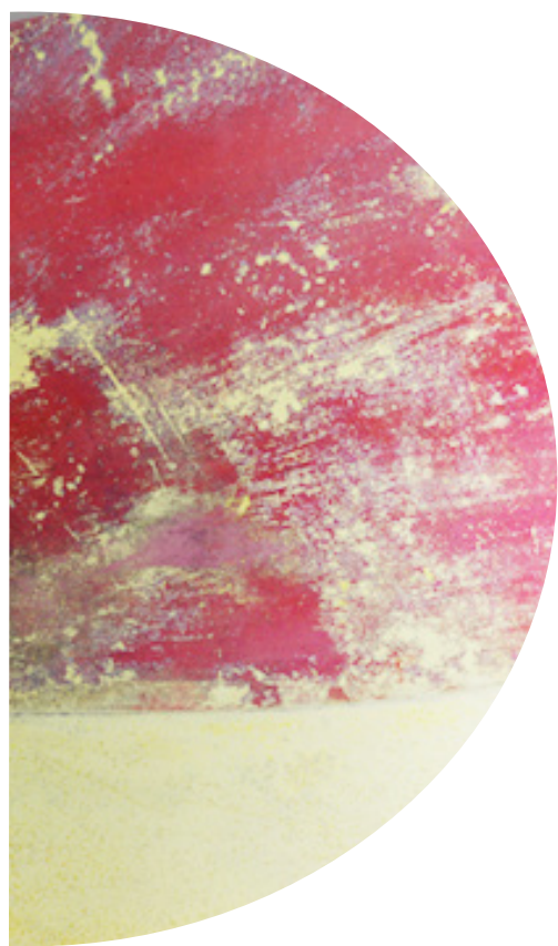
Crépuscule Ø 81 cm